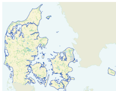
DDO®vektor Professionel oversigt