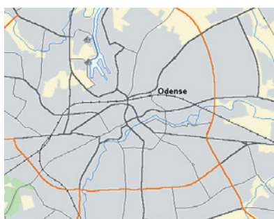
DDO ® vektor Light