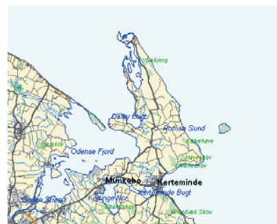
DDO®vektor Professionel i ca. 1:25.000