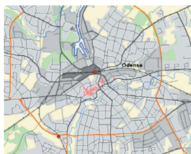
DDO ® vektor Plus